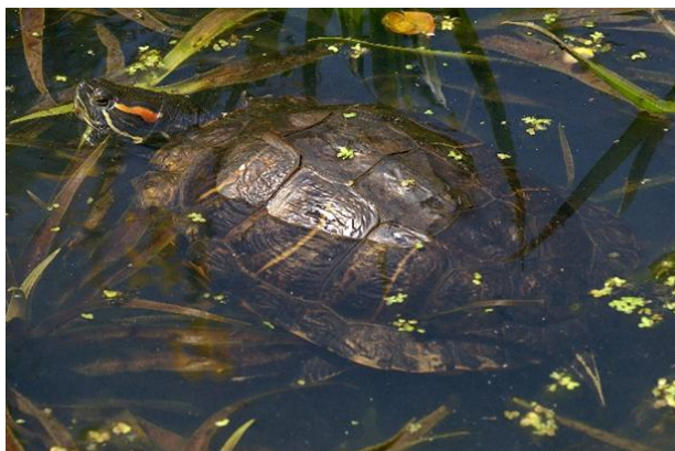
(Rotwangen-Schmuckschildkröte (links) und Gelbwangen-Schmuckschildkröte ( Trachemys scripta ))