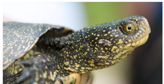
Europäische Sumpfschildkröte ( Emys orbicularis )

Neben exotischen Schildkrötenarten werden aber auch anderswo in der Schweiz einzelne Europäische Sumpfschildkröten beobachtet. Dabei handelt es sich um ausgesetzte oder ausgebüxte Einzeltiere, die allerdings jahre- oder jahrzehntelang in einem Gewässer existieren, sich aber in der Regel nicht fortpflanzen können. Gewisse exotische Schildkrötenarten können eine Gefährdung für einheimische Tierarten darstellen.