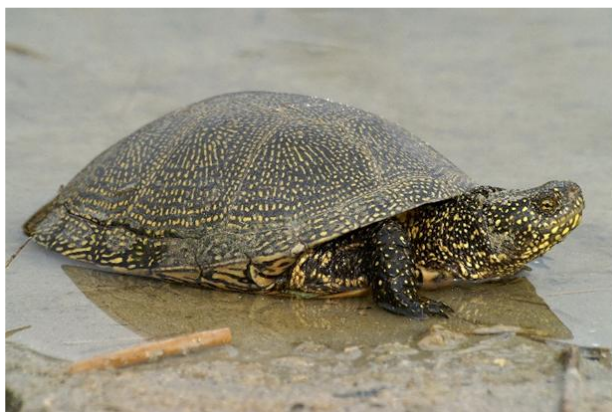
Europäische Sumpfschildkröte ( Emys orbicularis )