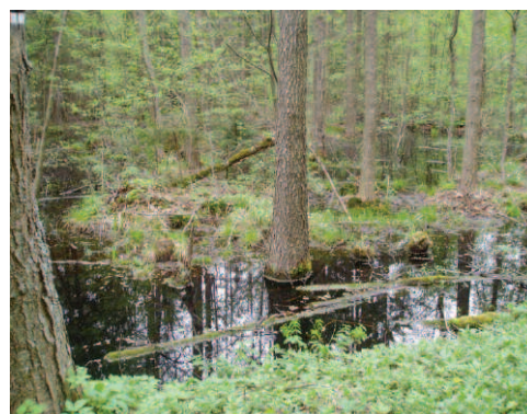
Figure 2. Série de mares à Loddington (GB, à gauche) et mares saisonnières en terrasse retenant l'eau hivernale à Bielowieza (Pologne, à droite), l'une des forêts européennes les plus naturelles.

Les mares et les étangs artificiels des plaines alluviales font maintenant partie intégrante des stratégies de régulation des inondations, telles que les plaines alluviales affluentes du captage de la Meuse. Ils sont souvent intégrés dans le cadre de projets de réhabilitation de fleuves (par ex. le Rhin inférieur).