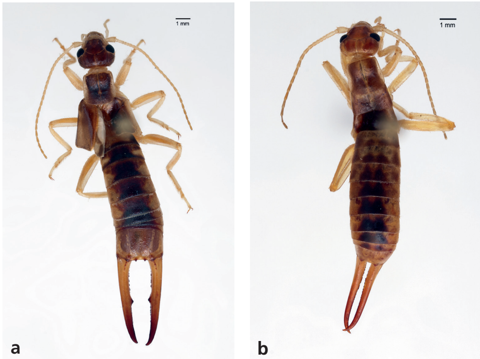
Fig. 1. Habitus de Labidura riparia récoltés à Chancy (GE), 16 avril 2020. a) Mâle adulte. b) Femelle au 5 e stade larvaire.