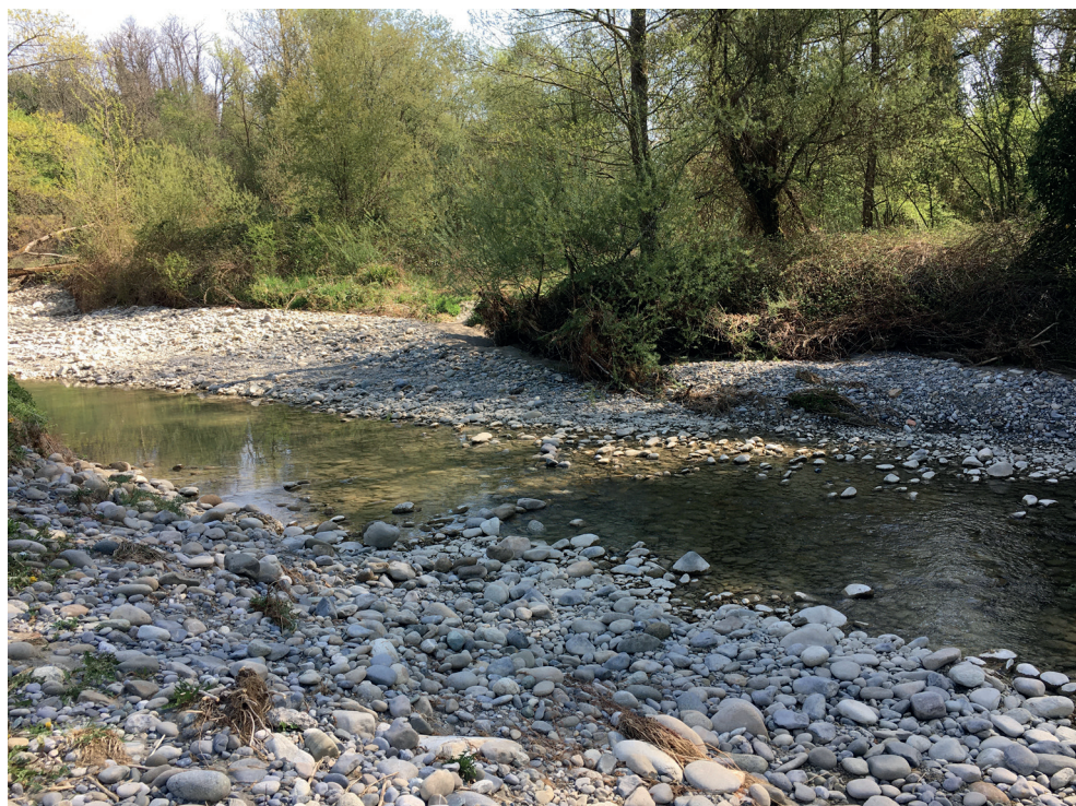
Fig. 2. Habitat de Labidura riparia sur le cours de La Laire à Chancy (GE), 16 avril 2020.

Carabidés (Coleoptera) de Suisse (Chittaro et al. 2020), trois spécimens de Labidura riparia ont en effet été découverts dans le canton de Genève: