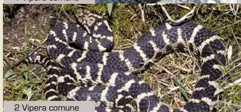
2 Vipera comune