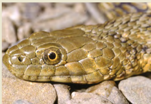
Natrice o Biscia tassellata – non velenosa

Le differenze tra serpenti velenosi e innocui della Svizzera risiedono soprattutto nella morfologia del capo: le pupille di Vipera comune e Marasso sono verticali, mentre quelle delle specie innocue sono rotonde; diverse sono pure le squame della testa. Si tratta però in entrambi i casi di caratteri difficilmente riconoscibili da una certa distanza. Inoltre, la colorazione e il disegno di molti serpenti sono molto variabili ed esistono forme melaniche sia tra le specie velenose sia tra quelle innocue (vedi figura a destra). La prudenza nei confronti di qualsiasi serpente è dunque fondamentale.