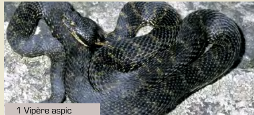
1 Vipère aspic

Un truc : tout serpent dépassant 90 cm de long est à coup sûr non venimeux, car les deux vipères indigènes ont toujours une taille inférieure.