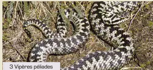
3 Vipères péliades