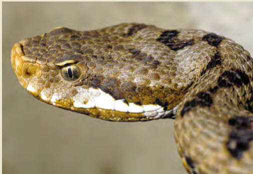
Vipère aspic – venimeuse