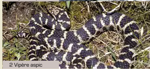
2 Vipère aspic